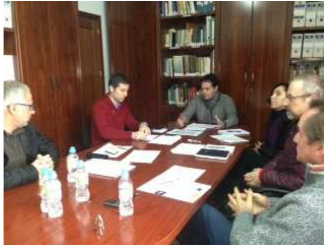
Comisión de Seguimiento Territorial La Siberia Herrera del Duque, 16 de febrero de 2015