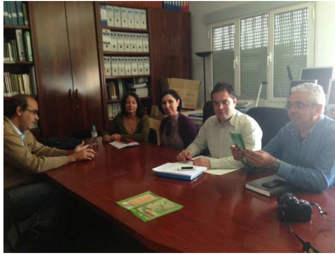
Comisión de Seguimiento Territorial La Siberia Herrera del Duque, 21 de abril de 2015