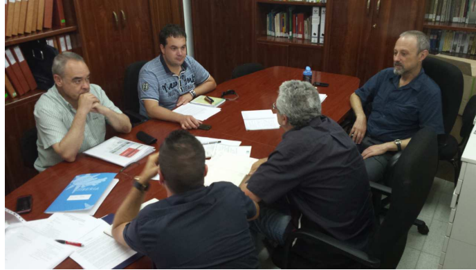
Comisión de Seguimiento Territorial La Siberia Herrera del Duque, 9 de junio de 2015