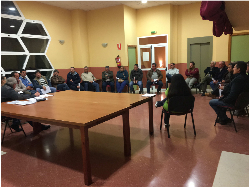
Sector cooperativo. Fuenlabrada de los Montes, 01.12.2015